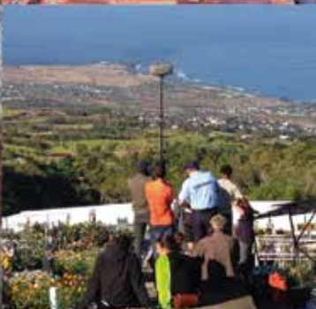
Photos de repérages, du tournage et du film